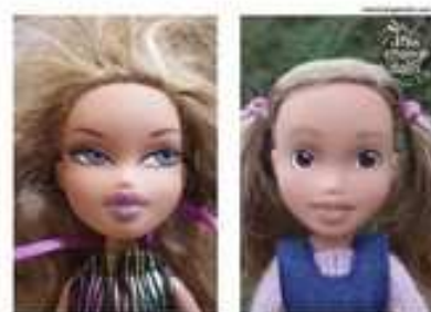
C'est la même poupée, seul le maquillage change