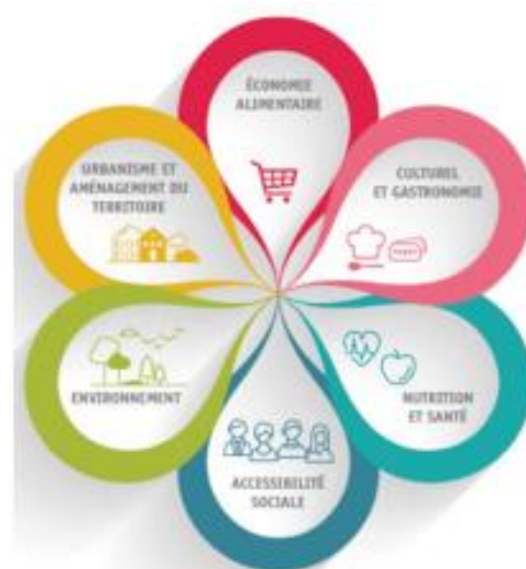
Les dimensions d'un projet alimentaire territorial