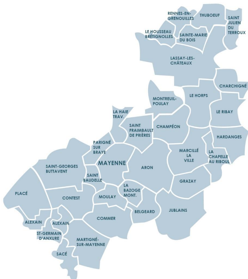
Annexe 1 : Carte de la communauté de communes Mayenne Communauté