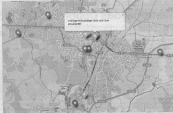
Une carte collaborative est proposée sur le site Internet de Mayenne Communauté. Il est possible d'y indiquer un endroit précis à préserver, à améliorer...