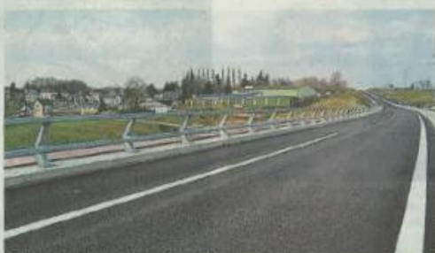
Deserte routière et ferroviaire, politiques de logement, communes de proximité ou encore installation de la fibre optique sont autant de sujets qui seront évoqués lors de ces réunions publiques.

Les habitants de Mayenne Communauté sont invités demain, à Lassaay-les-Châteaux et Mayenne, à penser l'avenir du territoire.