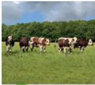
Le PLU va garantir aux agriculteurs des conditions d'exploitation satisfaisantes, en prévoyant des zones où la vocation agricole est protégée.

► Les Autres Politiques d'Accompagnement sont mentionnées à titre indicatif, pour démontrer la cohérence globale des actions de Mayenne Communauté.