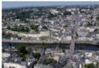
Les documents d'urbanisme vont définir les priorités en termes de logement.

Il décidera des zones dédiées à l'habitat ainsi que les types de logements qu'il sera possible de construire, les zones dédiées aux commerces, à l'industrie, les zones agricoles et celles à protéger.