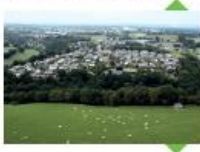
Le SCoT et le PLUi auront vocation à protéger les zones agricoles.