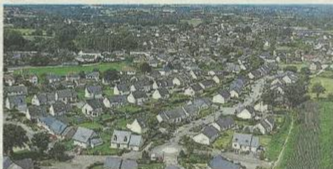
Le Schéma de cohérence territoriale prévoit une nouvelle offre d'environ 2 000 logements à l'horizon 2030.

L'élaboration du Schéma de cohérence territoriale (Scot) offre une vue sur l'aménagement du territoire dans 10 ans. Explications.