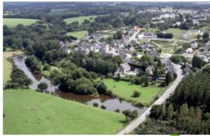
Le Schéma de Cohérence Territoriale (SCoT) sera le document de référence pour l'avenir de Mayenne Communauté, il servira de base à la construction du Plan Local d'Urbanisme intercommunal, qui définira les règles d'utilisation du sol.

Sur la base de ces trois ambitions fortes, le PADD du SCoT de Mayenne Communauté se décline en 3 grands volets :