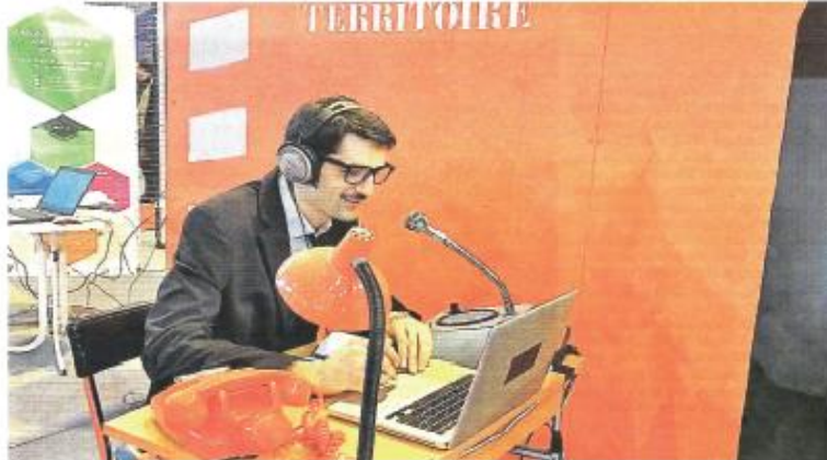
Comme pour les boîtes noires dans les avions, le couleur orange est dominante sur le stand.

Si « ce sont d'abord les femmes qui n'hésitent pas à y aller », des couples ou des hommes seuls franchissent aussi le pas.