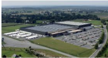
Le futur Plan Local d'Urbanisme Intercommunal (PLUI) prévoit de valoriser les potentiels des zones d'activités, dans le but de renforcer le rôle économique de Mayenne Communauté dans le département.

Seules les Prescriptions ont une valeur réglementaire et s'imposent de façon obligatoire aux documents de rang inférieur (Plan Local d'Urbanisme Intercommunal, Plan Local de l'Habitat), qui devront les mettre en œuvre.