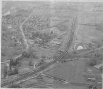
En 2016, le plan local d'urbanisme intercommunal devra être achevé comme l'exige la loi d'orientation relative aux zones d'activités.

Dans la même rubrique du site de la communauté de communes, une carte participative a aussi été mise en ligne. Le principe ? Poser un point sur la carte de Mayenne communauté, comme cet internaute qui suggère d'améliorer les entrées principales de la ville par une meilleure gestion de la pollution et l'amélioration de la qualité architecturale du bâti industriel, du réseau de boulevard Jean-Nollet, à Mayenne. Là encore, vous pouvez y prendre part au moins jusqu'en décembre 2016. Si l'inspiration est comblée,