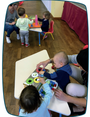
Recycler, créer, jouer

Les Matinées « Rencontre-éveil » : tout un prog'RAM