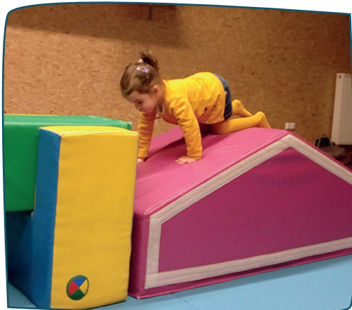
Séance de psychomotricité au complexe sportif Lucie Aubrac