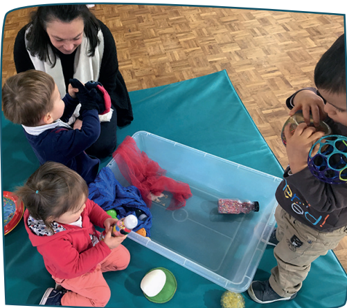
Découverte et éveil