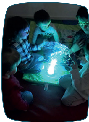
Rencontre intergénérationnelle autour de l'exploration sensorielle

Les Matinées « Rencontre-éveil » : tout un prog'RAM