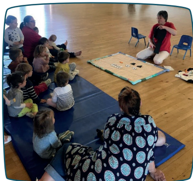
Partageons nos idées