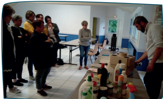
Conférence Action « gander dans un air sain »