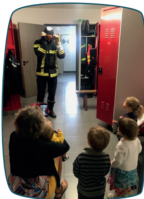
Visite de la Caserne des pompiers

Les Matinées « Rencontre-éveil » : tout un prog'RAM