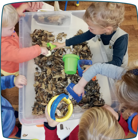
À la découverte des couleurs d'automne